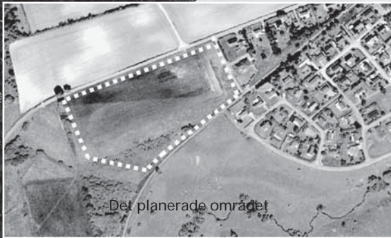
Det planerade området